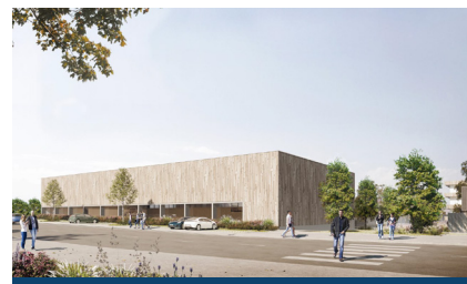
Le gymnase sera accessible aux associations depuis l'extérieur.

Des qualités qui lui permettront d'atteindre le niveau E3C1 du label "Energie plus Carbone moins" qui évalue l'empreinte carbone des bâtiments. E3 est synonyme d'efficacité énergétique et de recours aux énergies renouvelables ; C1 d'émissions de carbone basses, calculées sur l'ensemble du cycle de vie du bâtiment et sur les produits de construction utilisés.