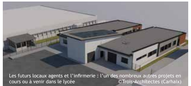
Les futurs locaux agents et l'infirmerie : l'un des nombreux autres projets en cours ou à venir dans le lycée ©Trois-Architectes (Carhaix)

la maintenance quotidienne du lycée. Ils comprendront des espaces techniques, des ateliers, la lingerie, des vestiaires ainsi que l'infirmerie. Cette dernière reste temporairement installée dans un modulaire près du service de restauration. Une nouvelle chaufferie bois, qui deviendra la chaufferie principale de l'établissement, sera créée dans le bâtiment A. Les autres installations au gaz, plus anciennes, seront également remises à neuf.