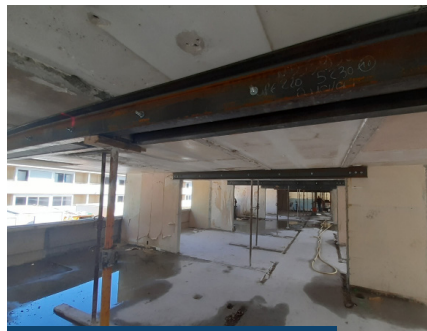
(avant - septembre 2022) Mise à nue du bâtiment B2

Les efforts consentis par chacun contribueront au bon déroulement du chantier : nuisances amoindries et sécurisation du chantier de la part des entreprises, réorganisation continue des espaces par le lycée, compréhension et respect des consignes de sécurité de la part de tous, professionnels, élèves, personnels éducatifs, administratifs et techniques.