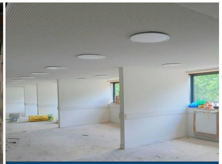
(après fin mai 2023) Finalisation du 2 nd œuvre dans le bâtiment B2.