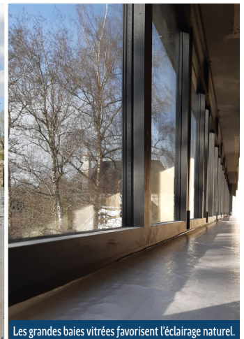
Les grandes baies vitrées favorisent l'éclairage naturel.