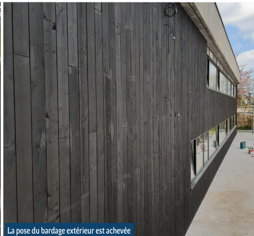
La pose du bardage extérieur est achevée