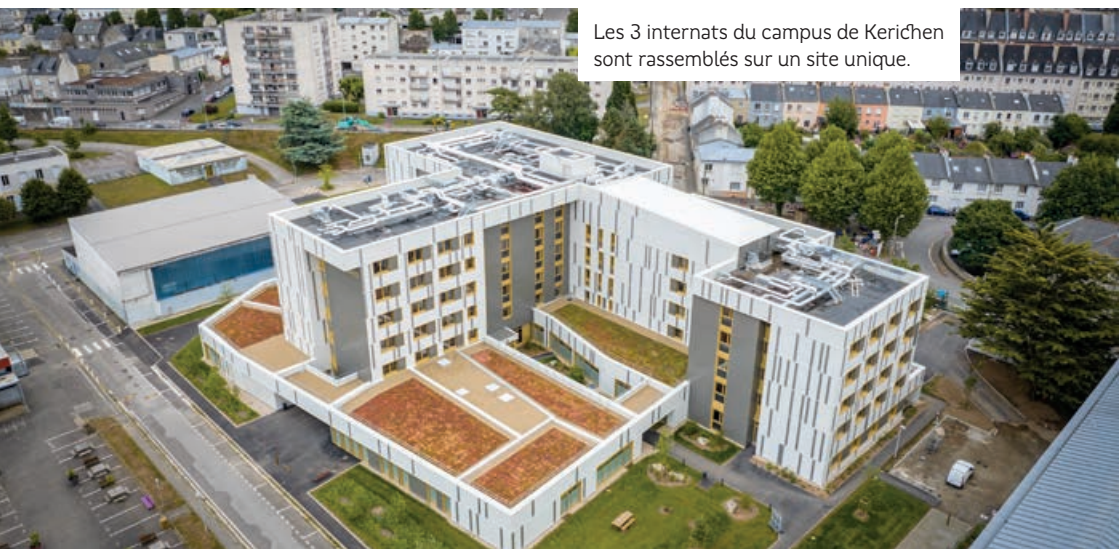
Les 3 internats du campus de Kerichen sont rassemblés sur un site unique.

Chaque étage (5 pour les lycées Vauban et Lesven, 4 pour La Pérouse-Kerichen) constitue une unité de dortoirs, dotée de deux blocs sanitaires et agrémentée de quelques îlots de détente. Les internats La Pérouse-Kerichen et Vauban disposent d'une unité dortoir supplémentaire au rez-de-chaussée.