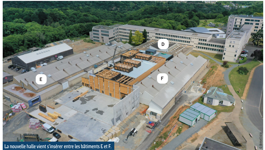
La nouvelle halle vient s'insérer entre les bâtiments E et F.