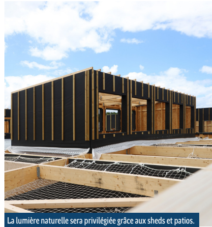
La lumière naturelle sera privilégiée grâce aux sheds et patios.