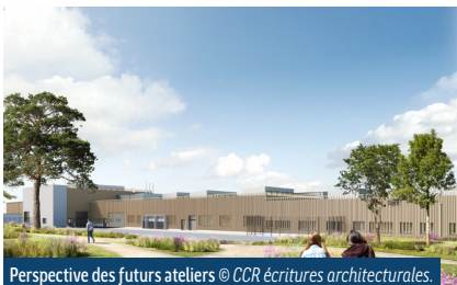
Perspective des futurs ateliers © CCR écritures architecturales.