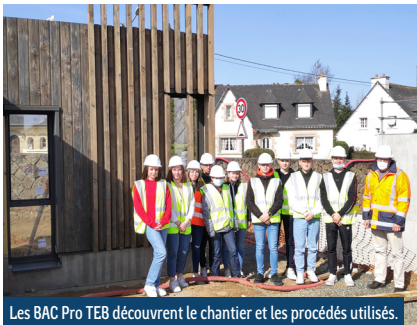
Les BAC Pro TEB découvrent le chantier et les procédés utilisés.