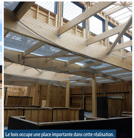
Le bois occupe une place importante dans cette réalisation.