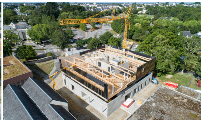
L'extension comprendra une salle polyvalente de 170 m 2 , le hall, l'infirmierie, l'administration et des salles de classe. Une liaison sera créée entre l'extension et le bâtiment A (en bas à droite au 1 er plan).