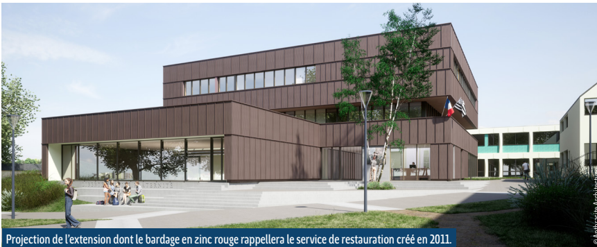
Projection de l'extension dont le bardage en zinc rouge rappellera le service de restauration créé en 2011.

Une vigilance particulière est demandée de la part de toutes et tous à l'entrée et aux abords du lycée. Si une voie d'accès est dédiée aux véhicules de chantier pour les éloigner du flux des élèves, ils entrent dans l'établissement par la voie de bus. Attention donc à bien respecter les panneaux de signalisation de chantier !